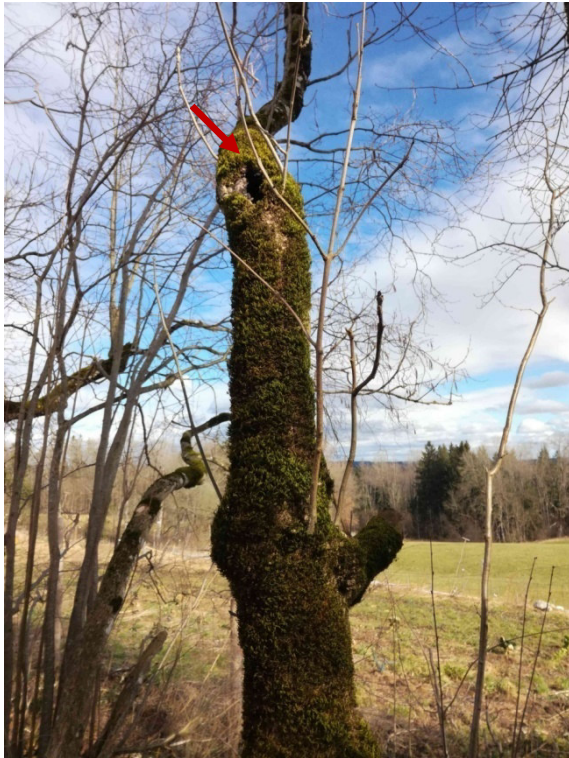
Abb. 12: Baum Nr. 11 mit tiefergehender Höhle