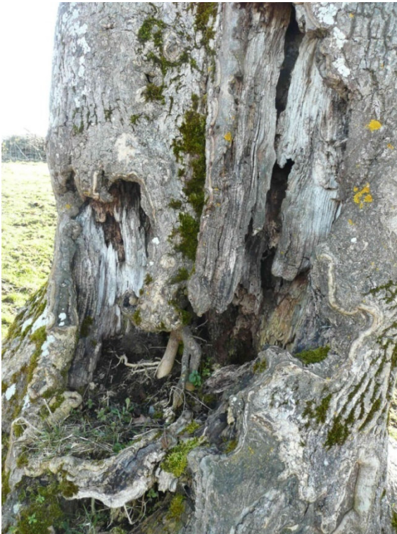
Abb. 10: Baum Nr. 7 mit Stammwunde und weit nach oben reichender Höhle