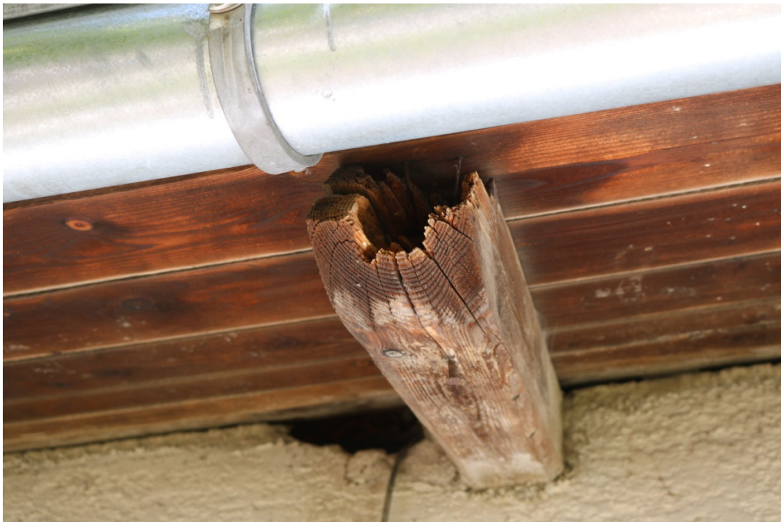
Abb. 2: Einflug- und Versteckmöglichkeiten an Gebäude 4