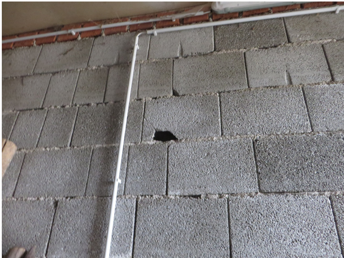
Abb. 4: Tiefe, sich nach oben ausweitende Löcher in der Wand im Erdgeschoss von Gebäude 1