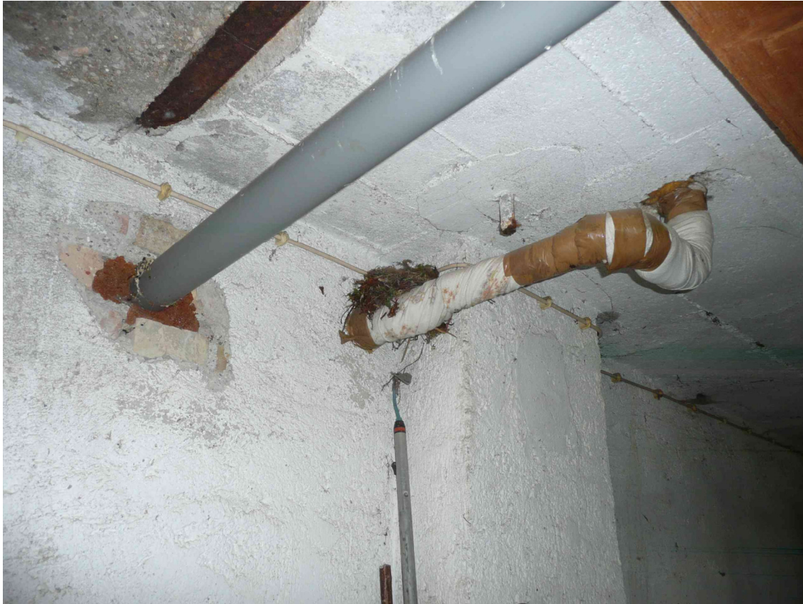
Abb. 7: Keller von Gebäude 10 mit Vogelnest (Hausrotschwanz).