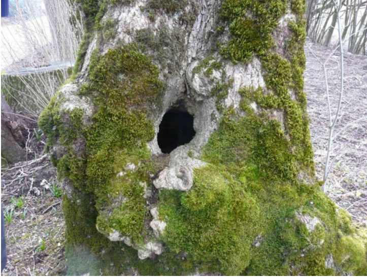
Abb. 9: Baum Nr. 10 mit tief gehender Höhle in ca. 50 cm Höhe