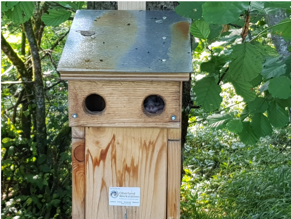
Abb. 8: Bilchkasten mit Siebenschläfer am 11.8.19