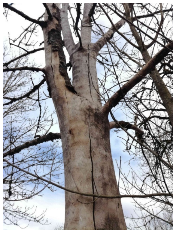
Abb. 15: Baum Nr. 20 mit tiefen Spalten und fehlender Borke