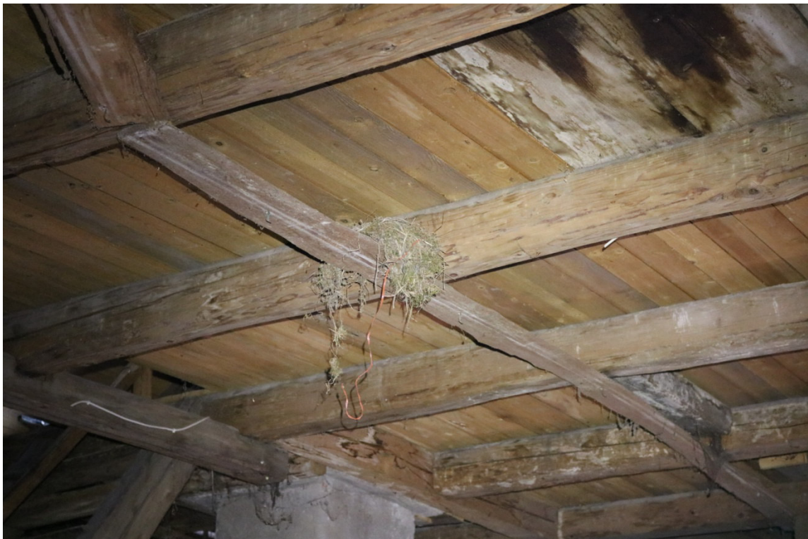
Abb. 6: Dachboden von Gebäude 7 mit Hang- und Versteckmöglichkeiten für Fledermäuse und einem Vogelnest