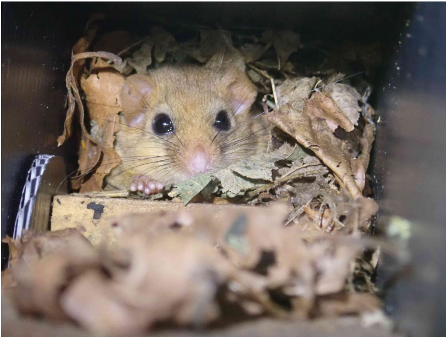
Abb. 17: Haselmaus in Nest-Tube Nr. 57 (Foto: C. Strätz, 9.9.20)