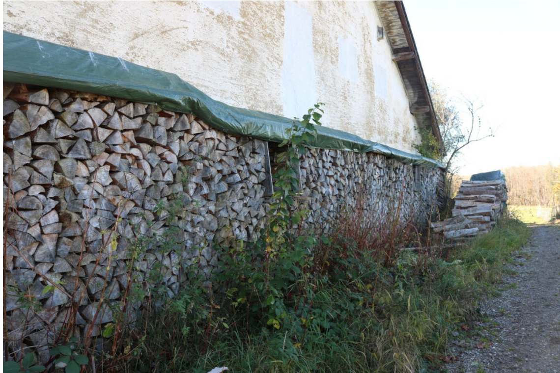
Abb. 3: Holzstapel vor Gebäude 5, ein potenzielles Winterquartier für Fledermäuse