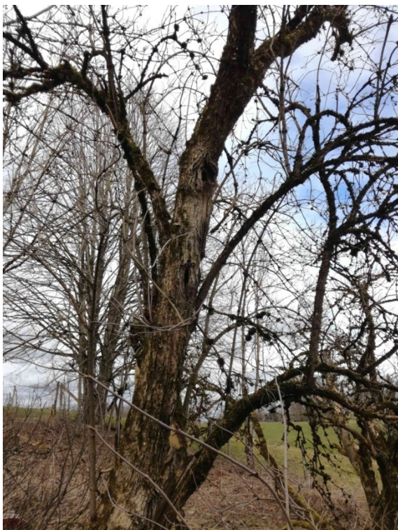
Abb. 14: Baum Nr. 19 mit mehreren Zugängen zu einer Höhle