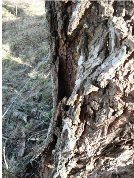
Abb. 13: Baum Nr. 4 mit abblätternder Rinde