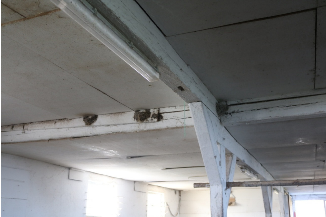
Abb. 5: Kuhstall mit vielen Rauchschnalbennestern in Gebäude 6