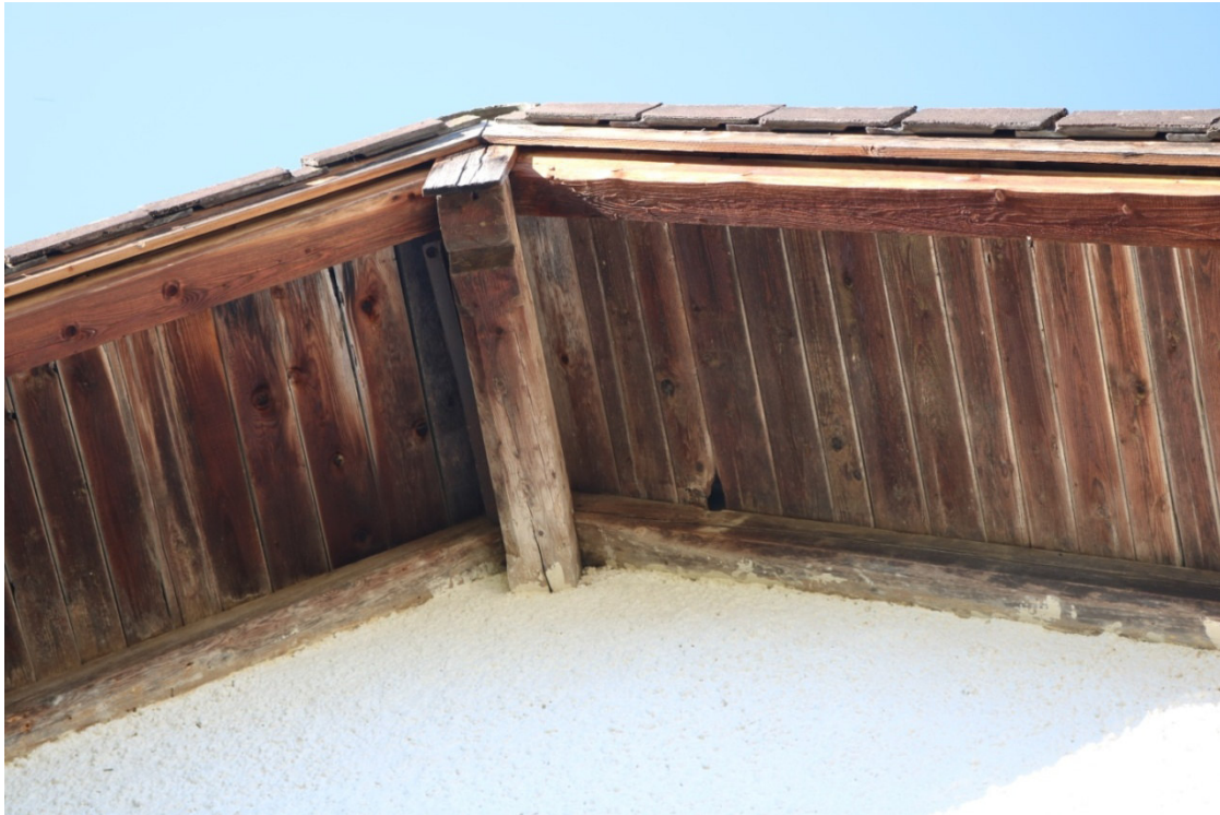
Abb. 1: Hölzerner Dachvorsprung von Gebäude 2 mit Spalten und Löchern, die potenzielle Sommerquartiere für Fledermäuse darstellen