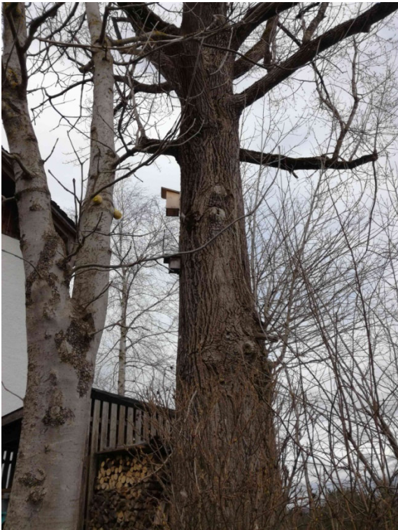
Abb. 16: Baum Nr. 15 mit zwei Vogelkästen