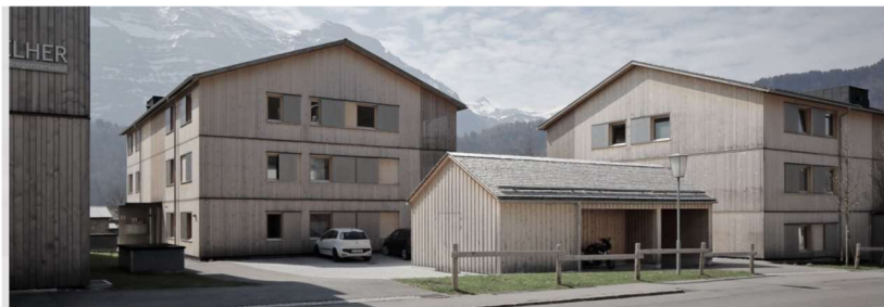
Abbildung 4: Wohn- und Geschäftshaus „Uf dr Säogo“ in Bizau, Bauherr: Kaufmann Liegenschaftsprojekte GmbH, Architekt: Johannes Kaufmann Architektur (Dornbirn)

Holzbau mit vertikaler, geschossweise abgesetzter, Lochfassade und zurückhaltendem Dachüberstand. Nebengebäude im gleichen Architekturduktus.