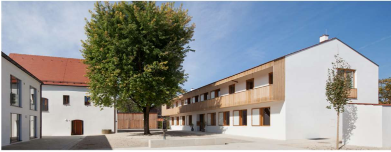
Abbildung 3: Neubau Pfarrhaus Ampfing, Bauherr: Pfarrpfüdestiftung Ampfing, Architekt: Deppisch Architekten GmbH (Freising)

Verputzter Massivbau mit Lochfassade und Holzelementen wie Fenstereinfassungen und Vorbauten / Balkone mit wenig Dachüberstand, um die Gebäudegrundform zu betonen.