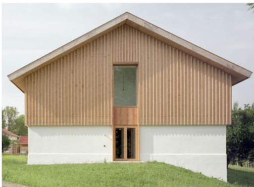
Abbildung 5: „Langes Haus“ in Karpfsee, Bauherr: Nantesbuch Stiftung, Architekt: Florian Nagler Architekten GmbH (München)

Massiver Erdgeschosssockel mit aufgesetztem Holzbau im Obergeschoss, senkrechte Holzverschalung und „plattenförmig“ ausgearbeiteten Dachüberstand.