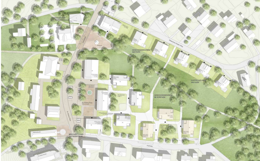
Abbildung 2: Städtebaulicher Entwurf des Architekturbüros LemmeLockeLux

Die „neue Ortsmitte“ von Bad Heilbrunn soll an die Maßstäblichkeit der umgebenden Bebauung anknüpfen und das Ortszentrum weiterentwickeln und stärken. Die Nutzungsmischung aus Gewerbe, Geschößwohnungsbau und Doppelhaus wurde gewählt, um Angebote für möglichst viele Bedarfsgruppen zu schaffen. Im Einzelnen werden folgende Ziele und Zwecke mit der Planung verfolgt: