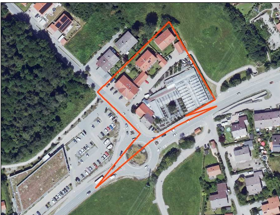
Orthophoto des Plangebietes rote Linie: Plangebiet des Bebauungsplanes „Südliche Birkenallee“ - 1. Änderung

Das ca. 0,73 ha große, östlich der Birkenallee und nördlich der Bundesstraße B 472 gelegene Plangebiet ist bauplanungsrechtlich bereits durch den Bebauungsplan „Südliche Birkenallee“ gefasst. Es ist durch einen an der Bundesstraße und Birkenallee gelegenen Gärtnereibetrieb, ein an der Birkenallee situiertes Wohn- und Geschäftshaus, sowie zwei hinterliegende Wohnhäuser (ein Doppelhaus und ein Einzelhaus) mit entsprechendem Gebäudeumfeld und Nebenflächen geprägt. Die angrenzenden Nutzungen zeichnen sich durch Wohnnutzungen im Norden, Freiflächen, die im Bebauungsplan „Am Krebsenbach-Angerlstraße“ als Misch- und Wohngebiete überplant sind, im Osten sowie einen im Westen an die Birkenallee angrenzenden Einzelhandelsmarkt aus. Ferner ist die südlich gelegene Bundesstraße mit Kreisverkehr für das Ortsbild prägend (s. Abbildung).